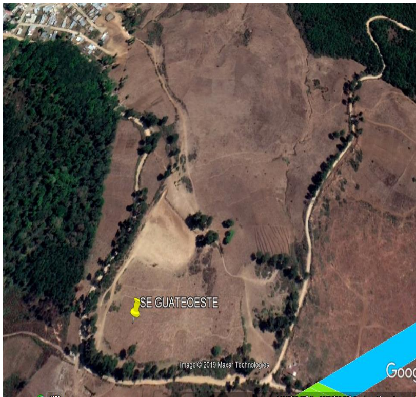
SUBESTACION GUATE OESTE